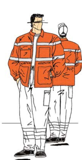
EN-SN 471, Klasse 2 EN-SN 471 classe 2