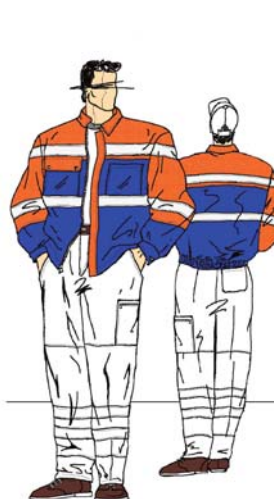
EN-SN 471, Klasse 2 EN-SN 471 classe 2