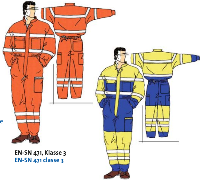
EN-SN 471, Klasse 3 EN-SN 471 classe 3