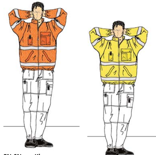
EN-SN 471, Klasse 3 EN-SN 471 classe 3