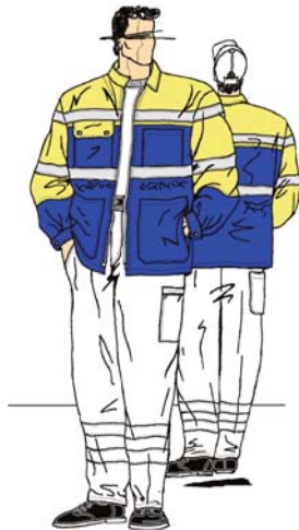
EN-SN 471, Klasse 2 EN-SN 471 classe 2