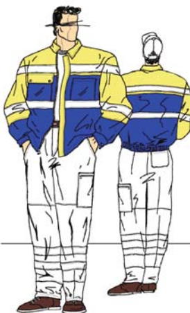
EN-SN 471, Klasse 2 EN-SN 471 classe 2